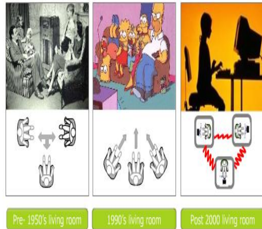
Pre- 1950's living room 1990's living room Post 2000 living room

A nivel familiar es bueno compartirla con los adultos, ya que ellos aprenderían más de las nuevas comunicaciones, pero debemos saber también que no podemos dedicar nuestro tiempo solo al ordenador, sino que también hacer un poco de ejercicio físico y relajación mental.