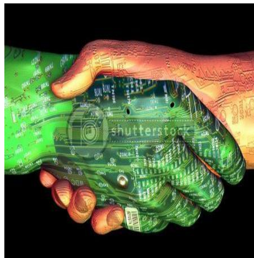
De la mano con la tecnología

http://www.razonypalabra.org.mx/antiores/n49/bienal/Mesa%209/VictorMartinez.pdf