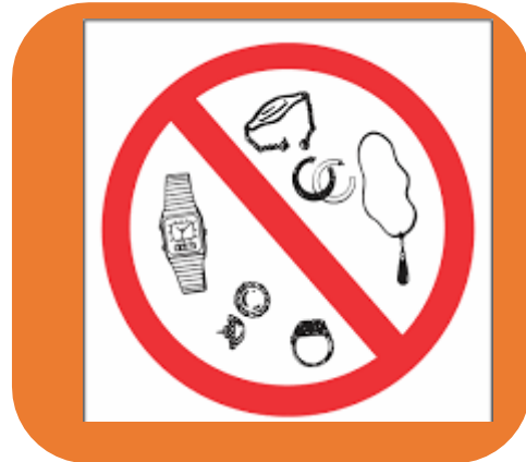
Prohibido el uso de joyería