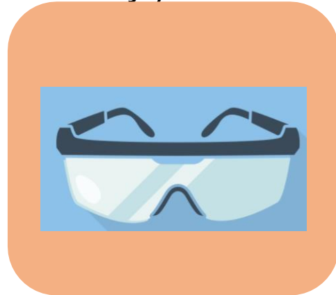
Gafas de protección