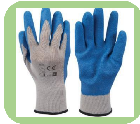
Uso de guantes de aislantes