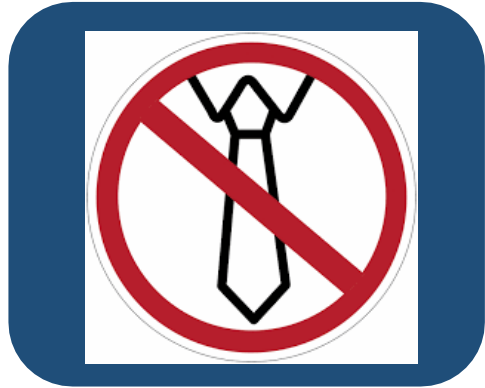
Prohibido usar corbata o bufanda