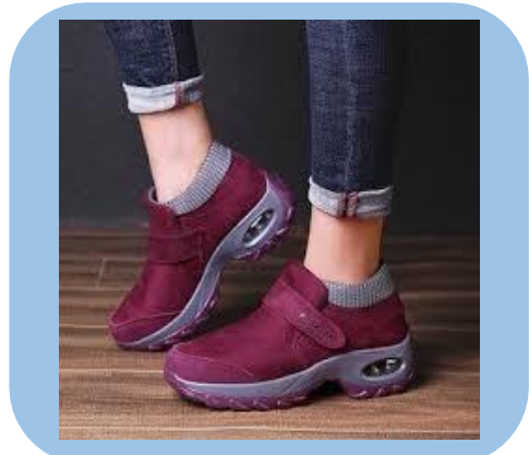
Zapatos cómodos con planta de caucho