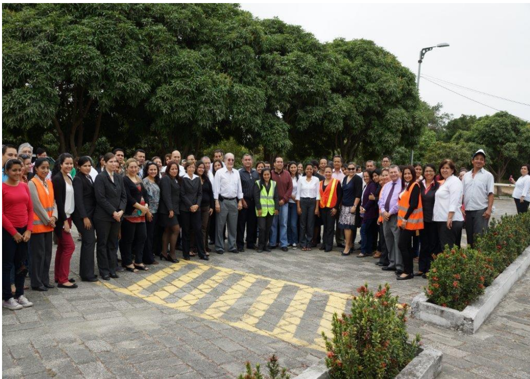
Las Autoridades, Directivos, Personal Administrativo y Estudiantes que laboran en el edificio El Rectorado que participaron en el "Simulacro de Evacuación".